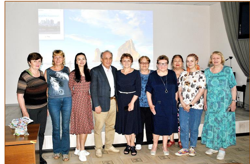
Участники II цифровой фотовыставки Института химии ДВО РАН

Также, как погружаясь в мир книги (а мы с вами на страницах альманаха «Власть книги»!), читатель узнаёт много нового о том, что нас окружает: об истории, людях, событиях, так и фотоискусство раздвигает привычные рамки обыденности, позволяет «среди войны и тщеты» задуматься о красоте, познать неизвестное, узнать много нового о нашем мире.